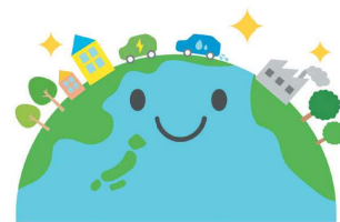
ゼロエミッション社会のイメージイラスト